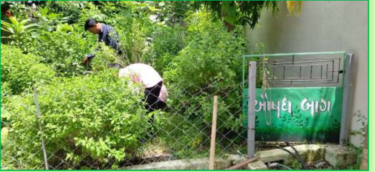
સરસાલી પ્રાથમિક શાળા તા. માંગરોળ